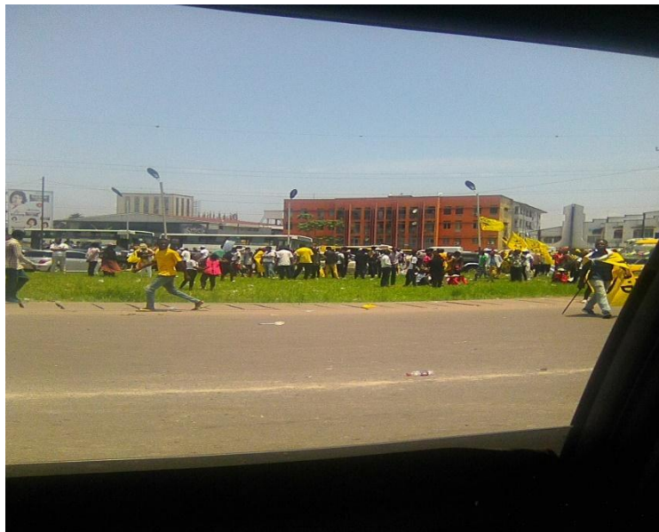
Jour de meeting politique à Kinshasa